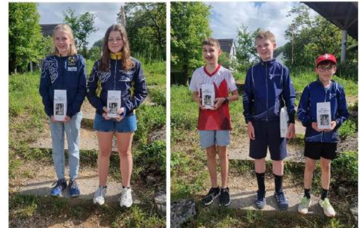
Podium der Kategorien D/H 14