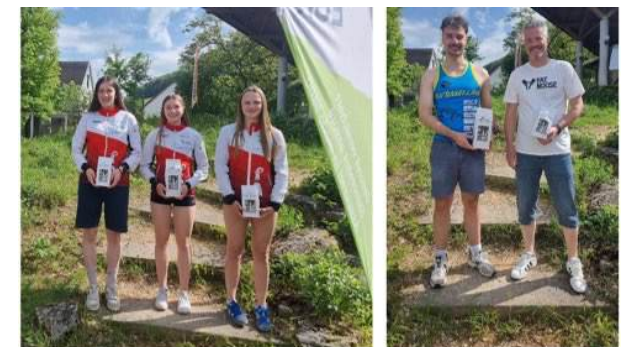
Podium der Kategorien D/H Sprint (D/H offen schwarz)